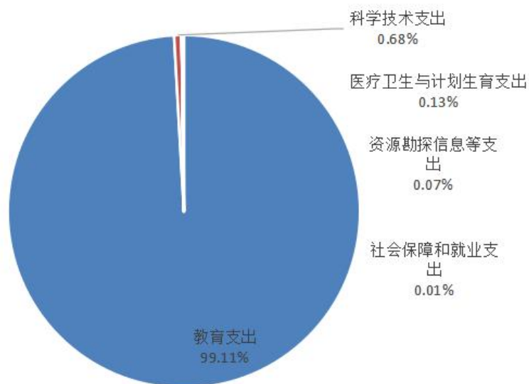
图三：财政支出决算结构图（按功能分类）